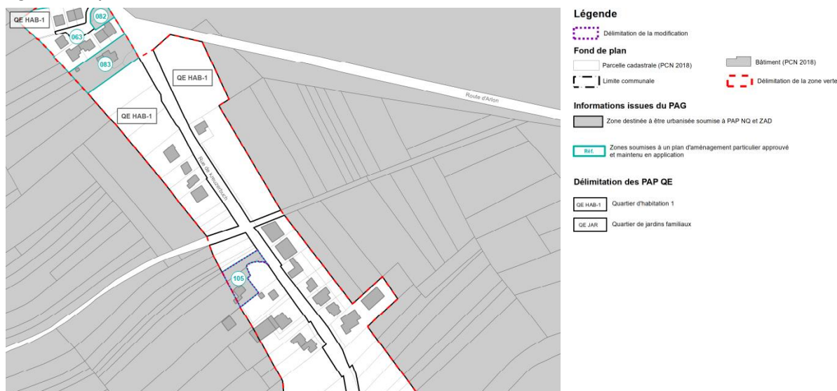
Figure 3 : Proposition de modification