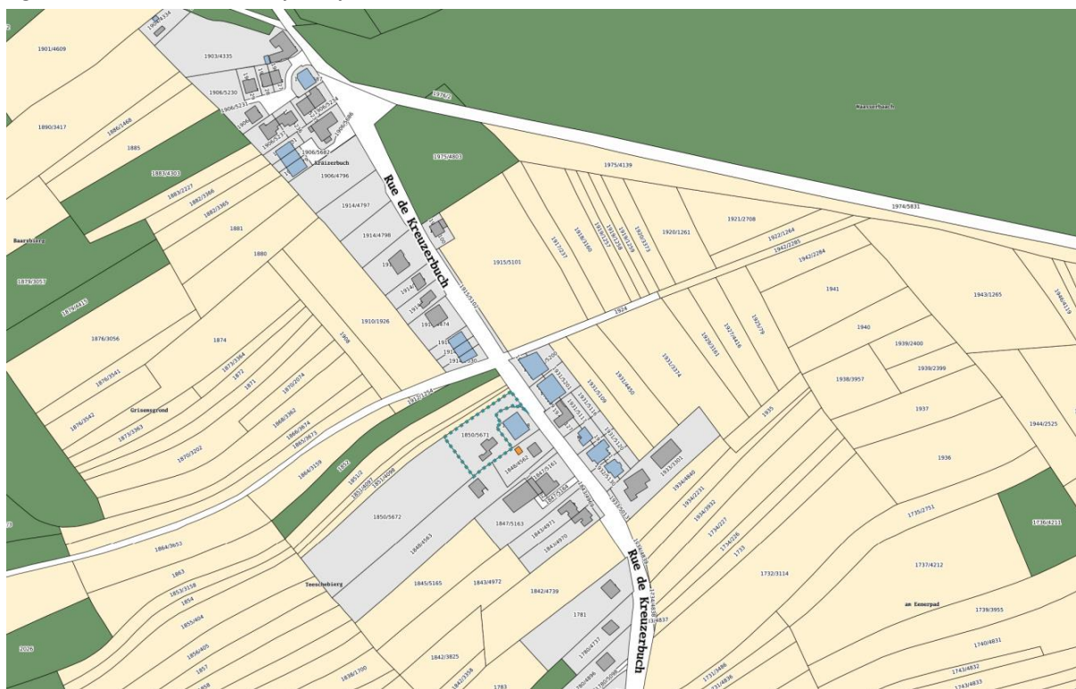
Figure 1 : Parcelles concernées par la présente demande

La présente demande de modification de la partie graphique du PAP-QE de Habscht s'inscrit en parallèle de la modification ponctuelle du PAG de Habscht. Elle est élaborée conformément à l'article 30 de la loi modifiée du 19 juillet 2004 concernant l'aménagement communal et le développement urbain. Elle porte sur la parcelle cadastrale n° 1850/5671, section HA de Hobscheid.